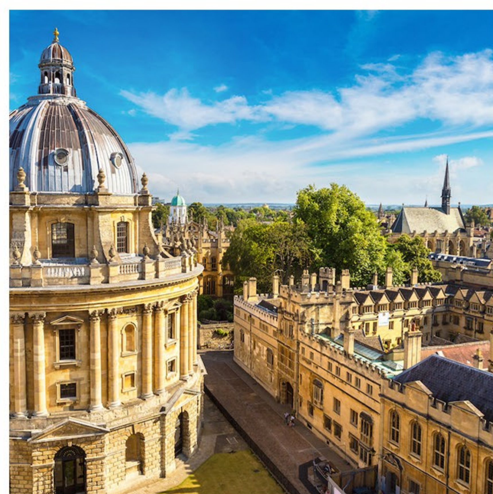
牛津探访 & 比斯特