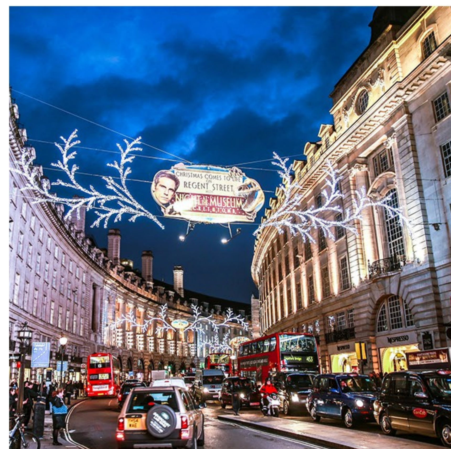
牛津街 & 摄政街