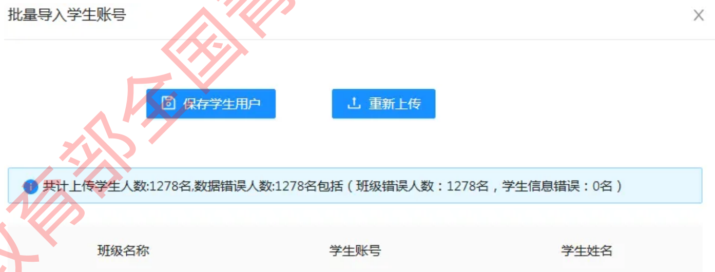
班级错误报错页面

2.上传提示“ 班级错误 ”，表示您的班级编号填写错误。 班级编号需填写系统自动生成的班级编号，不是班级名称，班级编号可在【班级管理】页面查看。