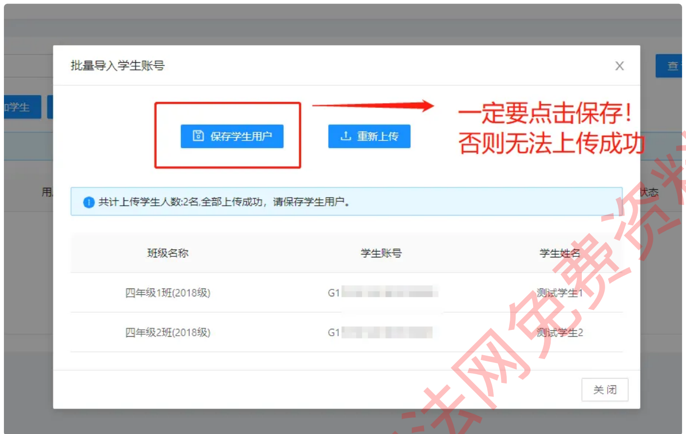
批量上传学生页面

生成的学生账号无等待认证步骤，可直接在【班级管理】中点击【导出】 获取学生学习账号及登录密码并可立即登录使用 。如登录不成功，一般为导入失败未留意报错提示，或导入后未点保存，可在学生管理页面或班级管理的班级明细中刷新查看是否已存在新导入学生，如不存在，请重新导入。